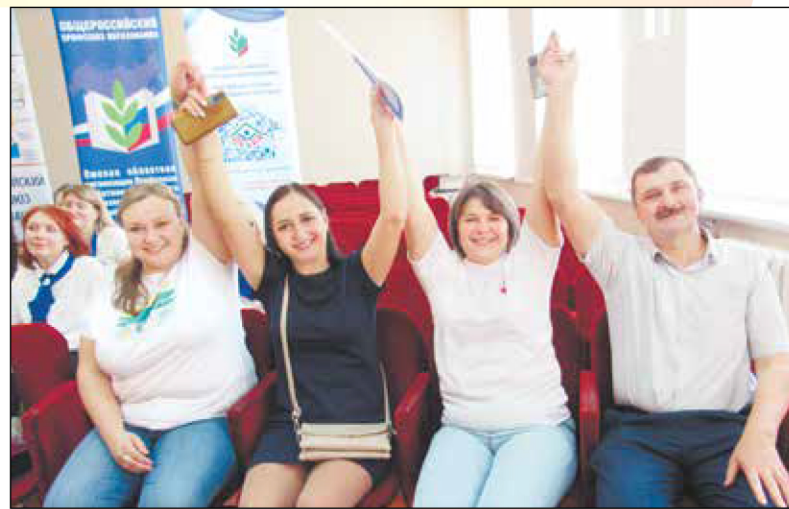
Участников вдохновляли группы поддержки.

В работе по защите интересов членов профсоюза профактив тоже всегда настойчив и решителен - добивается для них дополнительных льгот и гарантий. Например, в коллективе по инициативе профкома внесен пункт о предоставлении дополнительных дней отпуска за ра-