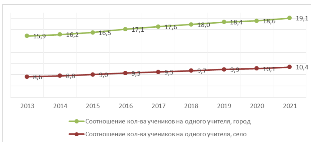
Рис. Динамика соотношения численности обучающихся в расчете на одного учителя (без учета совместителей) в среднем по РФ, в городской и сельской местности, человек.

Рост нагрузки проявляется не только в увеличении количества проводимых учителем уроков, но и в таких показателях, как наполняемость классов и количество обучающихся в расчете на 1 учителя. На начало 2021/2022 учебного года наполняемость классов городских школ составила 26,8 человек, сельских – 14,0 человек. По количеству обучающихся в расчете на 1 учителя: 19,1 – в городских школах и 10,4 – в сельских. Во многом это увеличение связано и с реализуемой кадровой политикой, ориентированной на повышение среднего уровня заработной платы учителей за счет повышения их нагрузки.