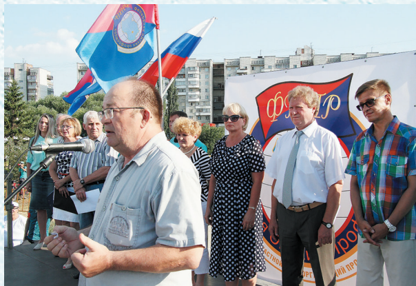
На митинге против пенсионной реформы. 2019 год.