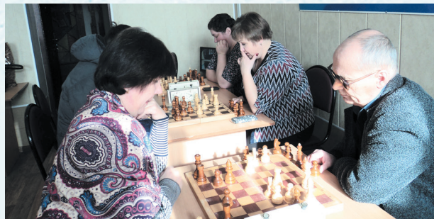
Спартакиада. Шахматы. 2017 год.

Ежегодно проводится районная зимняя спартакиада (в 2020 году она прошла в десятый раз), районный туристический слёт (в 2019 году в 51-й раз), спортивная эстафета «Старты с улыбкой» (в 2019 году в пятый раз).