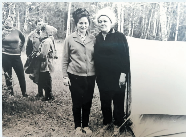
Туристический слёт. 1970 год.

Высока роль бесплатной юридической помощи. Новое звучание получают вопросы охраны труда, заключения коллективных договоров. Проведение локальных конкурсов по различной тематике в последние годы превратилось в профсоюзное конкурсное движение. Ключевыми становятся вопросы информационной политики.