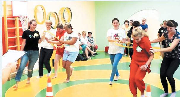
День здоровья. 2019 год.