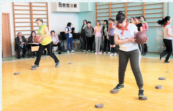
Кубок молодых учителей в рамках декады здорового образа жизни, посвящённой Дню здоровья. 2019 год.

Сегодня профсоюзная организация Знаменского района шагает в ногу со временем: дистанционное обучение и консультации, электронный профсоюзный билет и автоматизация учёта членов профсоюза... И как прежде, протягивает руку помощи, решает социальные проблемы и стремится отстаивать права и интересы всех членов профсоюза.