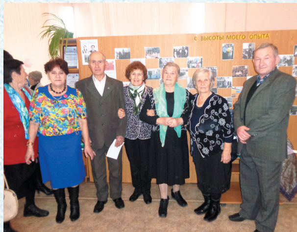
Встреча поколений. 2015 год.

Эти направления деятельности профсоюзного комитета остаются неизменными на протяжении многих лет. Сегодня меняются приоритеты и наполняемость каждого из разделов. Например, информационное обеспечение профсоюза становится одной из главных задач районной профорганизации. Необходимо оперативно доводить актуальную информацию по вопросам профсоюзной, производственной жизни и изменениям в законодательстве до рядовых членов профсоюза.