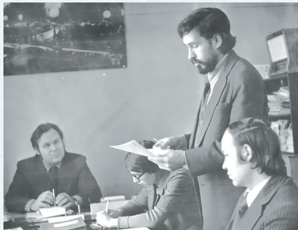
Заседание профсоюзного комитета ОмГУ. 1980 год.

В первичной профорганизации ОмГУ широко используют новые формы, такие как социальные сети, корпоративная почта, стали проводить дистанционные заседания профкома и президиума.