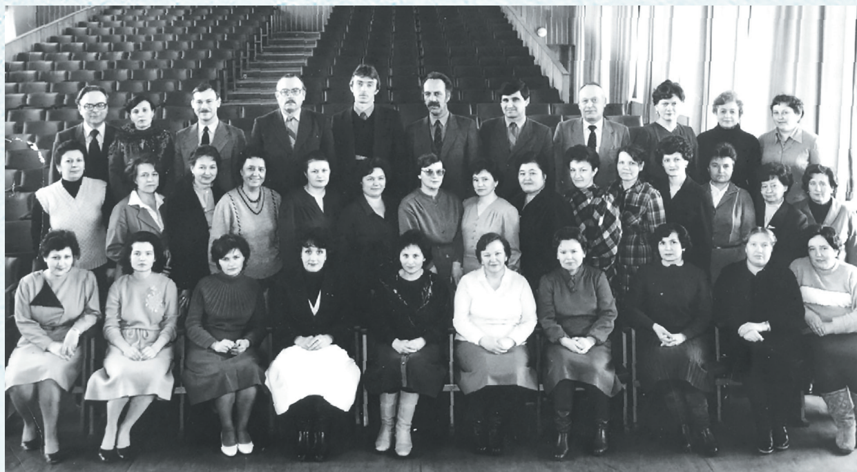
Профсоюзный актив Омской облпрофорганизации. 1984 год.

Оздоровлению способствовали действующие студенческие санатории-профилактории. Отрадно, что их база использовалась и для оздоровления учителей села, особенно в период их курсовой переподготовки в институте повышения квалификации. Для детей здесь организуются заезды «мать и дитя», пользующиеся большой популярностью среди работников отрасли.