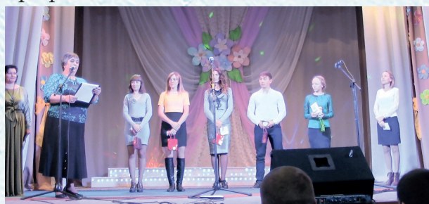
В рамках Дня учителя проходит честование молодых педагогов. 2014 год.

диняет работников, связанных родом деятельности и профессиональными делами, защищает их интересы. Насколько успешно он может работать в интересах каждого конкретного человека, зависит дальнейшая его судьба. Нижнеомская районная организация Профсоюза работников народного образования и науки РФ бережно сохраняет те профсоюзные традиции, которые в разные годы были заложены профактивом районной организации профсоюза.