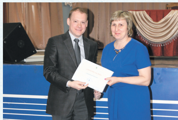
Вручение свидетельств об окончании обучающего семинара. 2016 год.