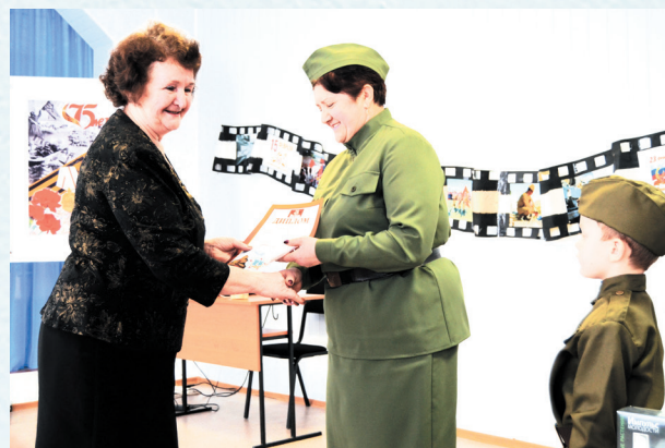
Награждение победителей конкурса чтецов «Памяти Победы». 2020 год.

Сегодня исилькульская районная организация объединяет 53 первичные профорганизации и насчитывает 1227 членов профсоюза. В октябре 2020 года она получила Свидетельство о занесении в Книгу Почёта Профсоюза работников народного образования и науки РФ.