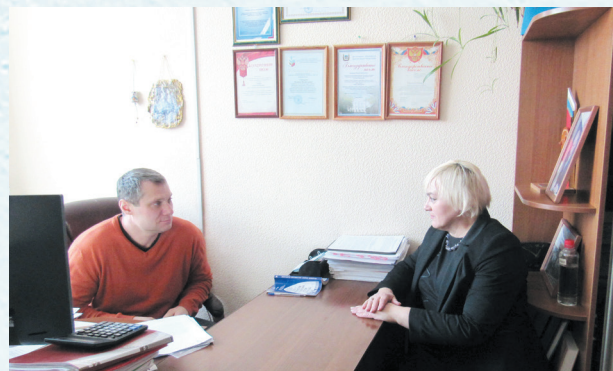
Идёт приём граждан. 2021 год.

Особое внимание уделяется рассмотрению обращений граждан, поступающих в устной и письменной формах. Среди вопросов: предоставление и перенос отпуска, коммунальные льготы педагогам и пенсионерам, выплата МРОТ и прочие.