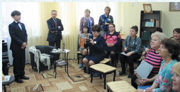
На уроке музыки в Казанском лицее. 2016 год.