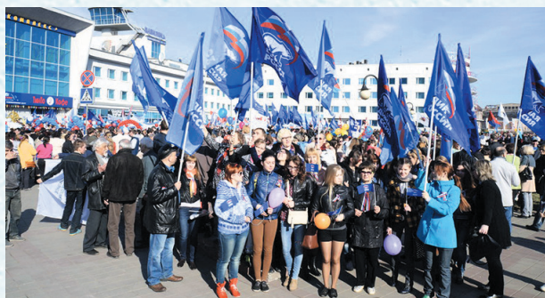
Первомайская демонстрация. 2014 год.

Необходимо также усилить контроль за охраной труда и техникой безопасности на рабочих местах. Участвовать в планировании повышения квалификации работников.