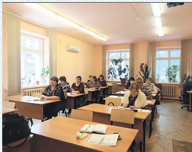
Совещание председателей первичных профсоюзных организаций. 2018 год.