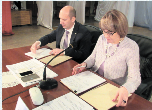
Подписание областного отраслевого соглашения о регулировании социально-трудовых и связанных с ними экономических отношений на территории Омской области в сфере образования. 2018 год.

Омская областная организация Профсоюза входит в число региональных организаций, которым удалось добиться полного охвата территориальными согла-