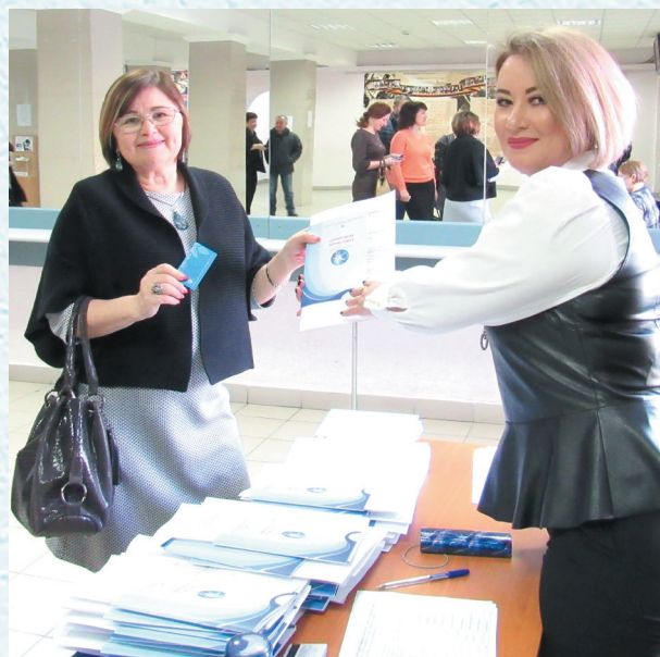
Вручение электронных профсоюзных билетов. 2019 год.

На 1 января 2021 года в Реестре Омской областной профорганизации зарегистрировано 44157 членов профсоюза.