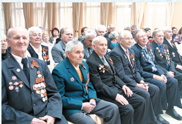
Поздравление ветеранов с Днём Победы. 2012 год.