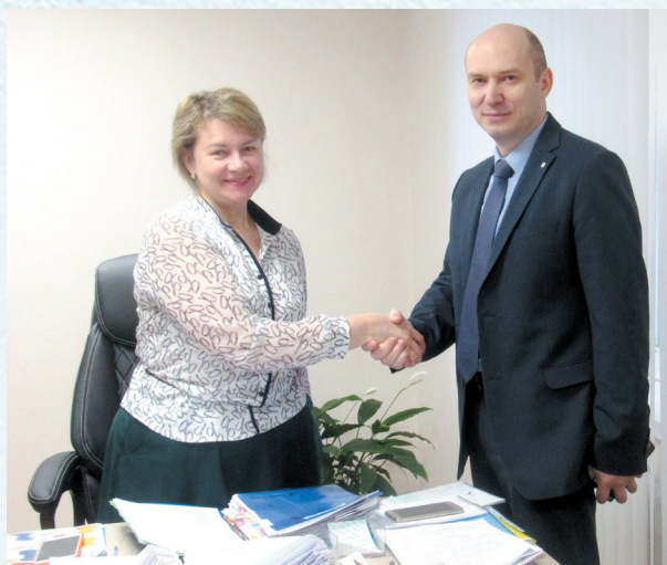
Подписание соглашения между департаментом образования администрации города Омска и Омской областной организацией Профсоюза. 2020 год.