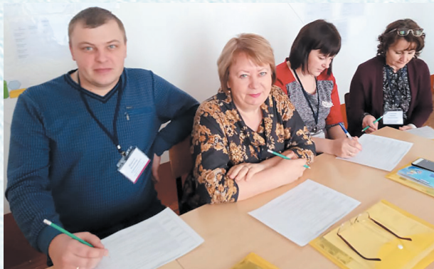
Работа в жюри регионального этапа конкурса «Воспитатель года». 2019 год.

Сила любой профсоюзной организации в создании единого организованного коллектива единомышленников, в определении чётких целей и задач профсоюзной работы. В одиночку сегодня защитить свои интересы невозможно.