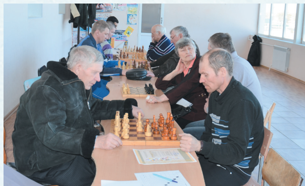
Спартакиада работников образования. Шахматы. 2019 год.

В районе проводятся зимние спартакиады работников образовательных учреждений, победители участвуют в областной спартакиаде работников образования.