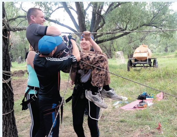
Профсоюзный квест. 2018 год.