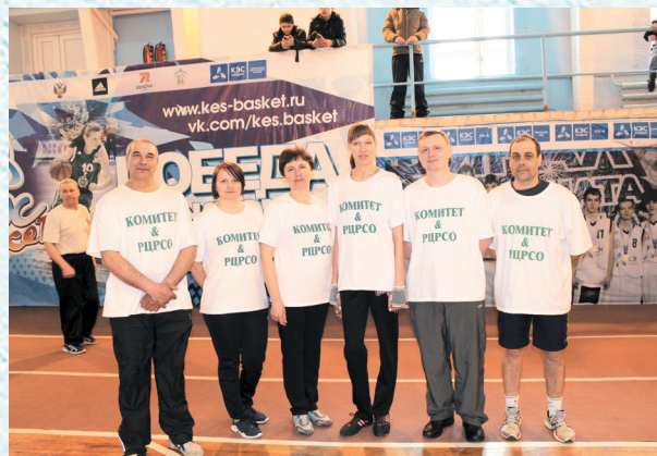
Выполняем нормы ГТО. 2019 год.