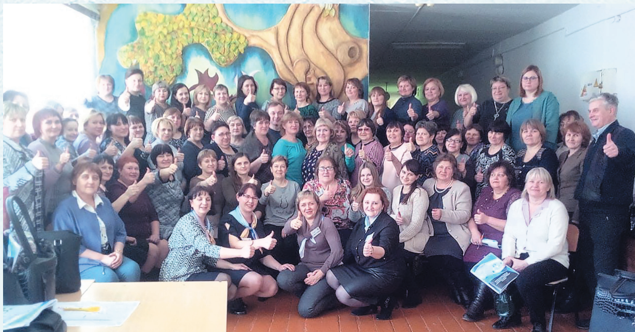
Участники тренинга «Навыки XXI века». 2019 год.