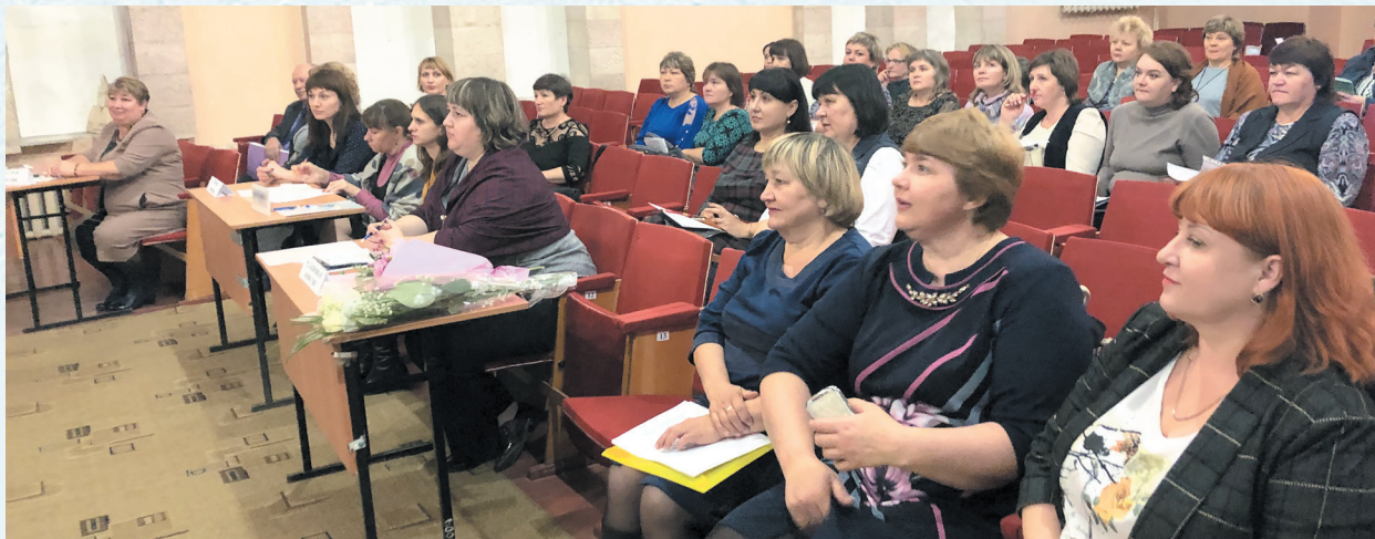
Заседание комитета. 2019 год.