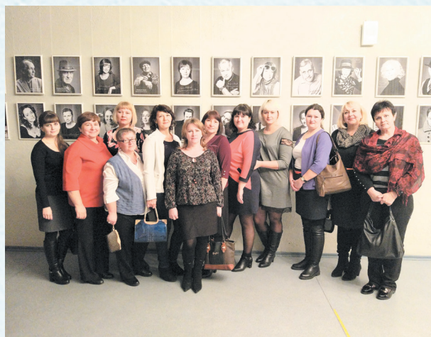
Профактив в театре юного зрителя в Омске. 2015 год.