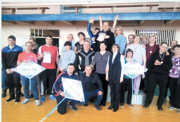
Спартакиада. Победители и призёры (вверху). Перетягивание каната (внизу). 2019 год.