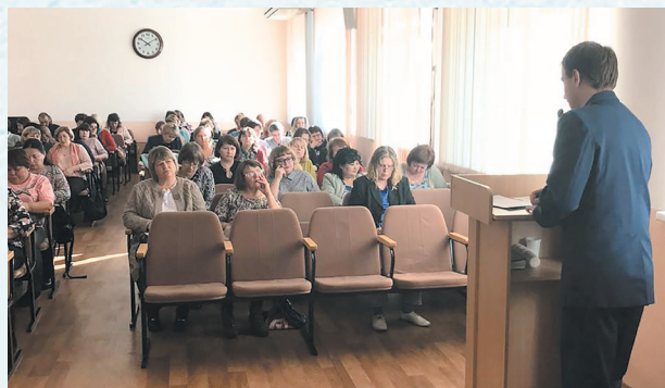
Семинар-совещание с приглашением специалистов прокуратуры. 2018 год.

С целью привлечения выпускников высших и средних профессиональных учреждений, пришедших работать в учреждения образования, ежегодно Комитет по образованию совместно с комитетом