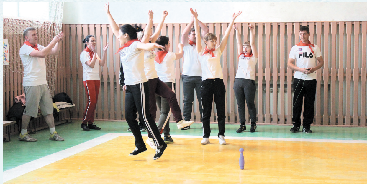
Спортивное мероприятие «Кубок молодых учителей». 2019 год.