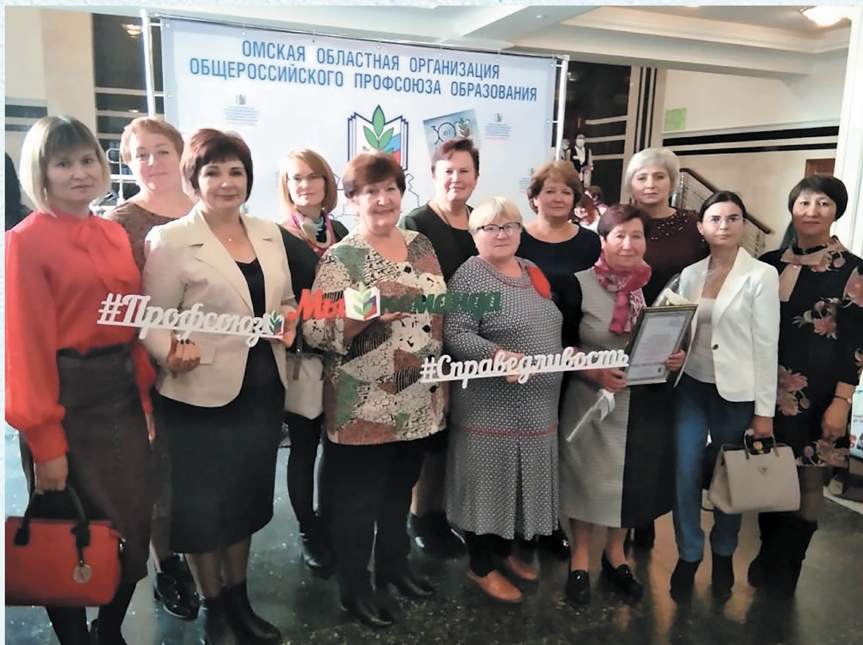
На празднике 30-летия Общероссийского Профсоюза образования. 2020 год.