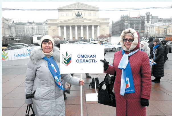
В Москве на всероссийской акции «За достойную заработную плату». 2012 год.

Райком профсоюза уделяет большое внимание здоровью учителей и их детей. Ежегодно в конце июня на берегу Ачаирской протоки проводятся соревнования по туризму, футболу, русской лапте и плаванию среди членов профсоюза, осенью – по спортивному ориентированию. На протяжении многих лет осуществляются туристско-оздоровительные выезды в Боровое. Молодёжи оказывается материальная помощь на оздоровление в санатории Омской области, в том числе и в «Оптимисте». Успешно реализуется программа «Оздоровление и лечение», которая отлично работает на повышение мотивации профсоюзного членства. Реализуется проект по введению единого электронного профсоюзного билета, автоматизации учёта членов профсоюза и сбора статистических данных. Успешно ведётся работа с использованием социальных сетей («Одноклассники», «ВКонтакте», YouTube, Instagram, WhatsApp и других) в Интернете.