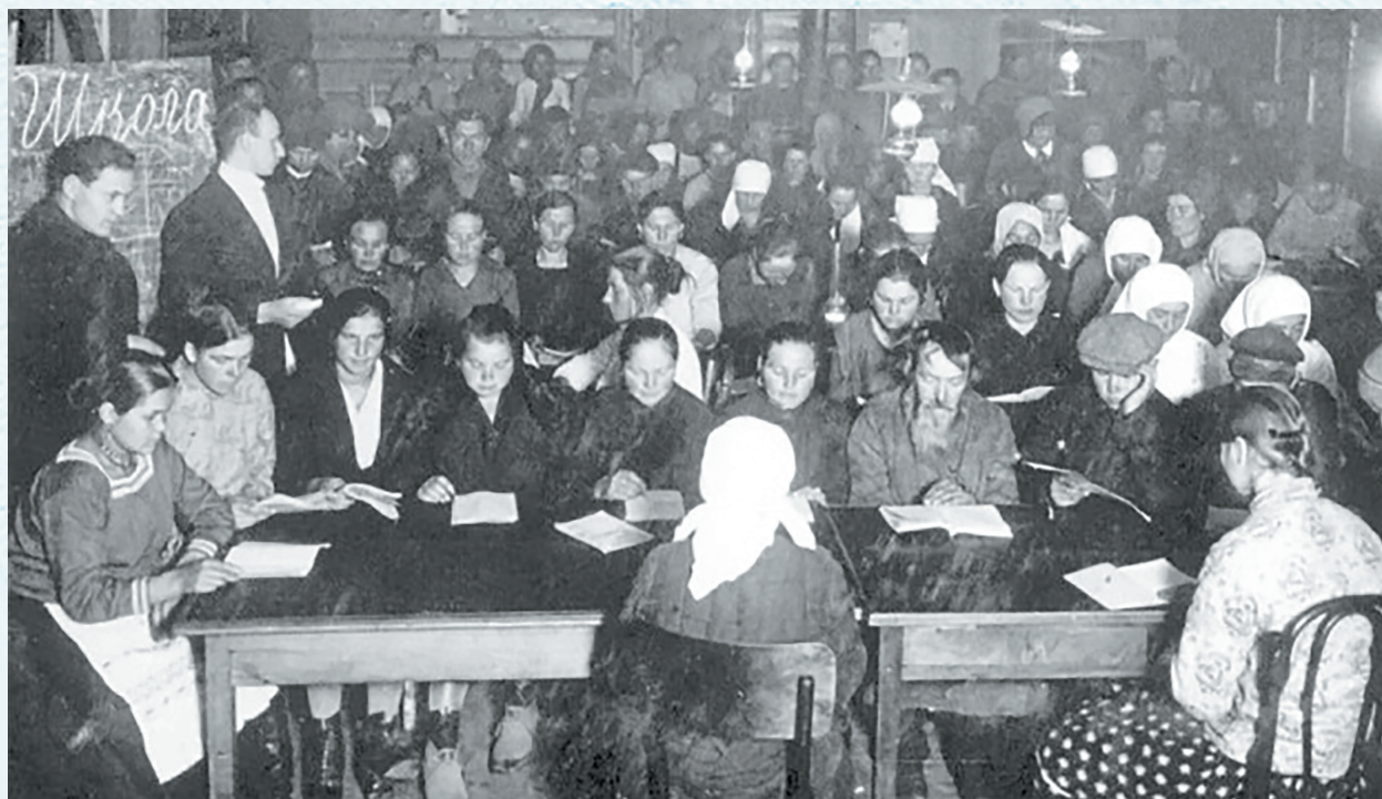
Неоценим вклад учительского союза в дело ликвидации безграмотности. Школа ликбеза. 1933 год.

В 1963 году в Омской области завершена реорганизация семилетних школ в восьми-