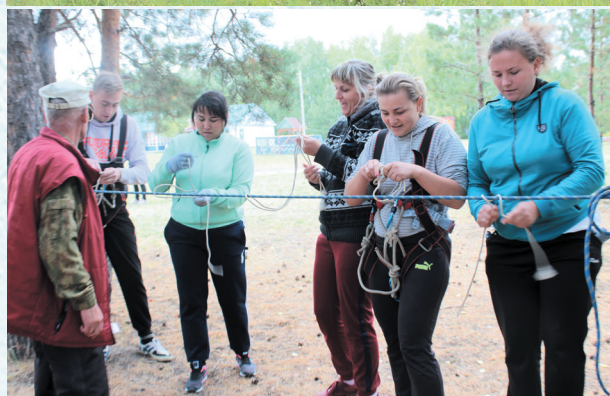
Турслёту 50 лет. 2018 год.