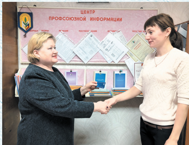
Вручение электронного профсоюзного билета. 2019 год.

Основными задачами профорганизации по-прежнему остаются защита прав и интересов работников, улучшение условий труда, контроль над соблюдением коллективных договоров и условий охраны труда. Профактив стремится к увеличению профсоюзного членства и при поддержке председателя Комитета по образованию ведёт регулярную работу в этом направлении.