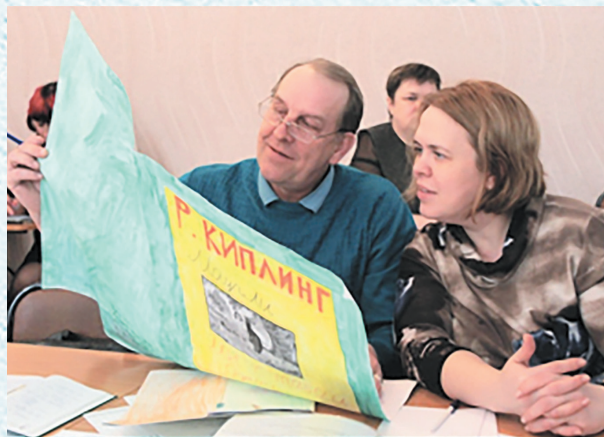
Районный фестиваль педагогических проектов. 2019 год.

Любая профсоюзная организация сильна своим коллективом, ведь если нет коллектива – нет организации, а цель любого профсоюзного лидера – вовлечь в профсоюз как можно больше людей.