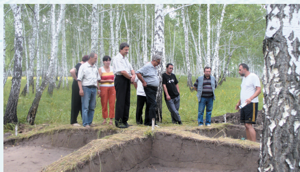
На раскопках. 2009 год.

В век информационных технологий ключевыми становятся вопросы оперативной передачи информации. Председатели первичных организаций учреждений образования создали группу «ВКонтакте», в которой обмениваются новостями, делятся впечатлениями, высказывают своё мнение.