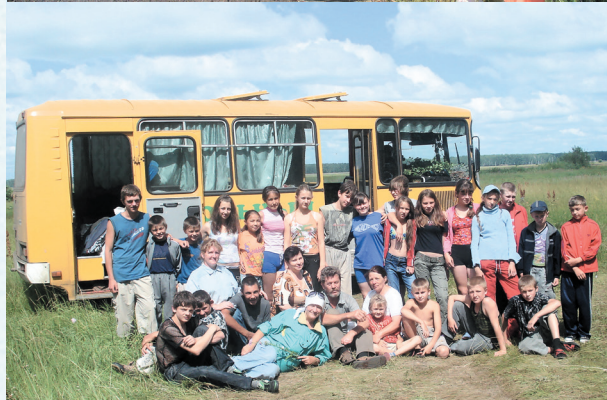
Выезд членов профсоюза и обучающихся на территорию национального археологического природного парка «Батаково». 2009 год.