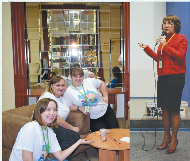
На IV профсоюзном форуме молодых педагогов Омской области. 2018 год.

Для создания условий, способствующих продуктивному взаимодействию,