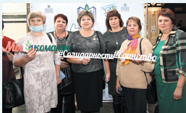
Профактив тарской районной организации. 2020 год.

Конкурсы, спартакиады, выставки, проводимые районной профсоюзной организацией, делают педагогические будни интересными и запоминающимися. Они предоставляют возможность педагогам проявить творчество, показывать свои способности и самореализовывать себя в самых различных направлениях деятельности, делиться знаниями и опытом.