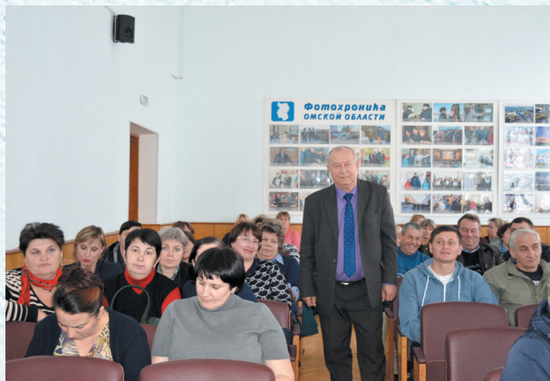
Семинар по охране труда. 2017 год.

В перспективе Одесская районная организация Профсоюза нацелена на укрепление единства и повышение эффективности деятельности первичных профсоюзных организаций, мотивацию профсоюзного членства, на плодотворную деятельность по защите трудовых прав членов профсоюза, на участие в новых проектах и программах с целью улучшения положения работников системы образования.