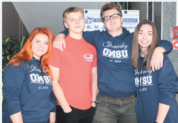
Профактив студентов ОмГУ имени Ф. М. Достоевского. 2019 год.

Среди задач видятся следующие: всестороннее развитие студентов посредством форумов, школ профактива, привлечение их к организации мероприятий всех возможных уровней, создание для активистов социального лифта через профсоюзную деятельность, разработка значимых для студенческого сообщества вуза грантовых проектов на всех возможных уровнях, внедрение инновационных методов работы со студентами и развитие социального партнёрства с администрацией университета в рамках профсоюзной деятельности.