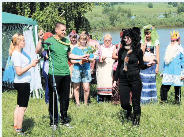
Культурно-спортивный праздник. 2017 год.

Ещё одна замечательная традиция зародилась в год 70-летия Победы в Великой Отечественной войне. Комитет районной профсоюзной организации выступил инициатором и организатором ежегодных тематических фестивалей художественной самодеятельности работников образования Горьковского района.