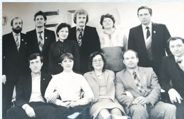
Спортсмены-«первомайцы». 1984 год.

В последнее десятилетие уходящего века профсоюзная организация округа обрела опыт борьбы за социальные права (забастовки, пикеты, митинги).