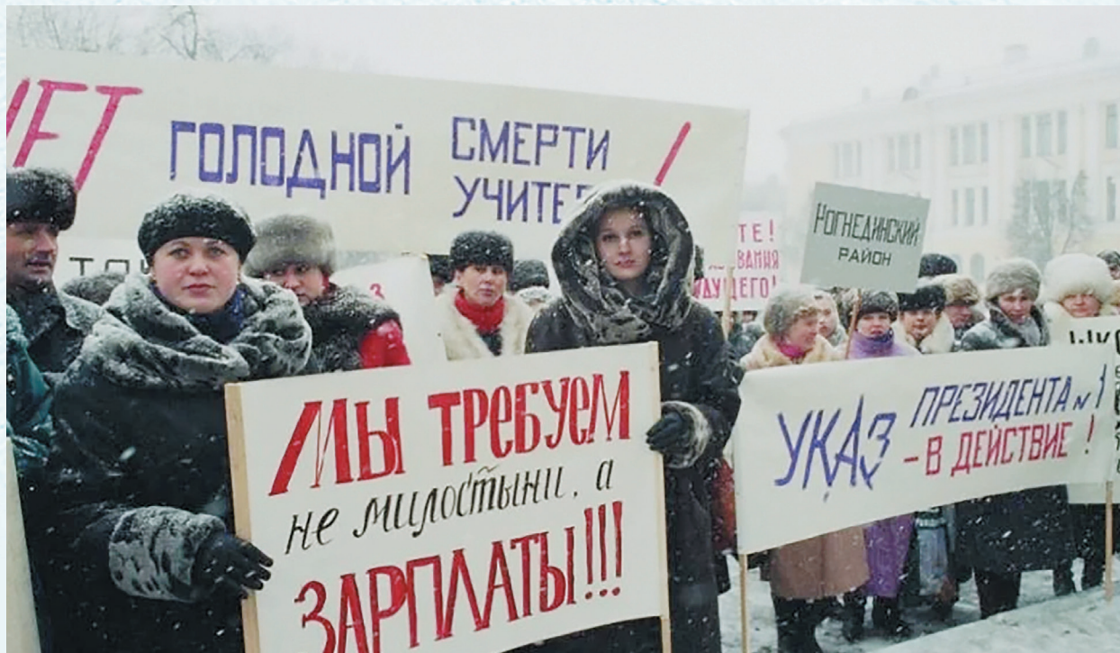
Учительское забастовочное движение. 1990-е годы.

Обком профсоюза занял активную позицию, выражая полное несогласие