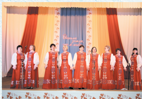
Фестиваль художественной самодеятельности «К новым творческим вершинам». 2016 год.