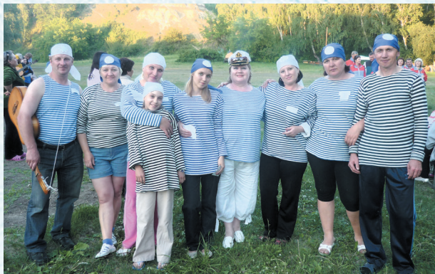
Туристический слёт. 2010 год.