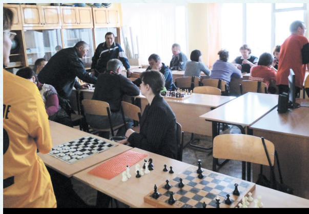
Спартакиада. Шахматы. 2018 год.