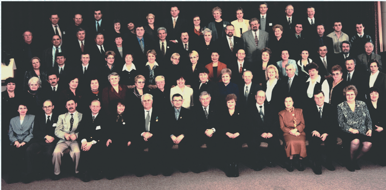
На V съезде Профсоюза работников народного образования и науки РФ. Москва. 2005 год.

26–27 сентября 1990 года прошёл Учредительный съезд Профсоюза работников