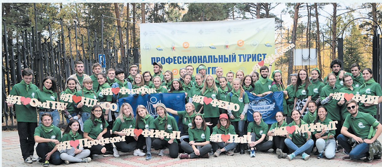
Региональный туристический слёт. 2018 год.

В ближайших планах профсоюзной организации увеличение численности студентов магистерской ступени подготовки, а также реализация проекта «Чистая вода», предполагающая размещение во всех корпусах питьевых фонтанчиков или кулеров. Продолжить оборудовать в корпусах ОмГПУ Bubble-зоны для отдыха.