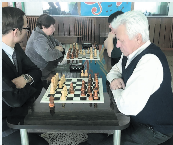
Ветераны принимают участие в спартакиаде. 2019 год.

Основные задачи, которые сегодня ставит перед собой профсоюзная организация Омского района: укрепление районной профсоюзной организации за счёт привлечения молодых педагогов, расширение и укрепление социального партнёрства профсоюзной организации с общественными организациями района, защита социально-трудовых прав работников образовательных организаций, создание безопасных условий труда, соответствующих санитарным нормам.