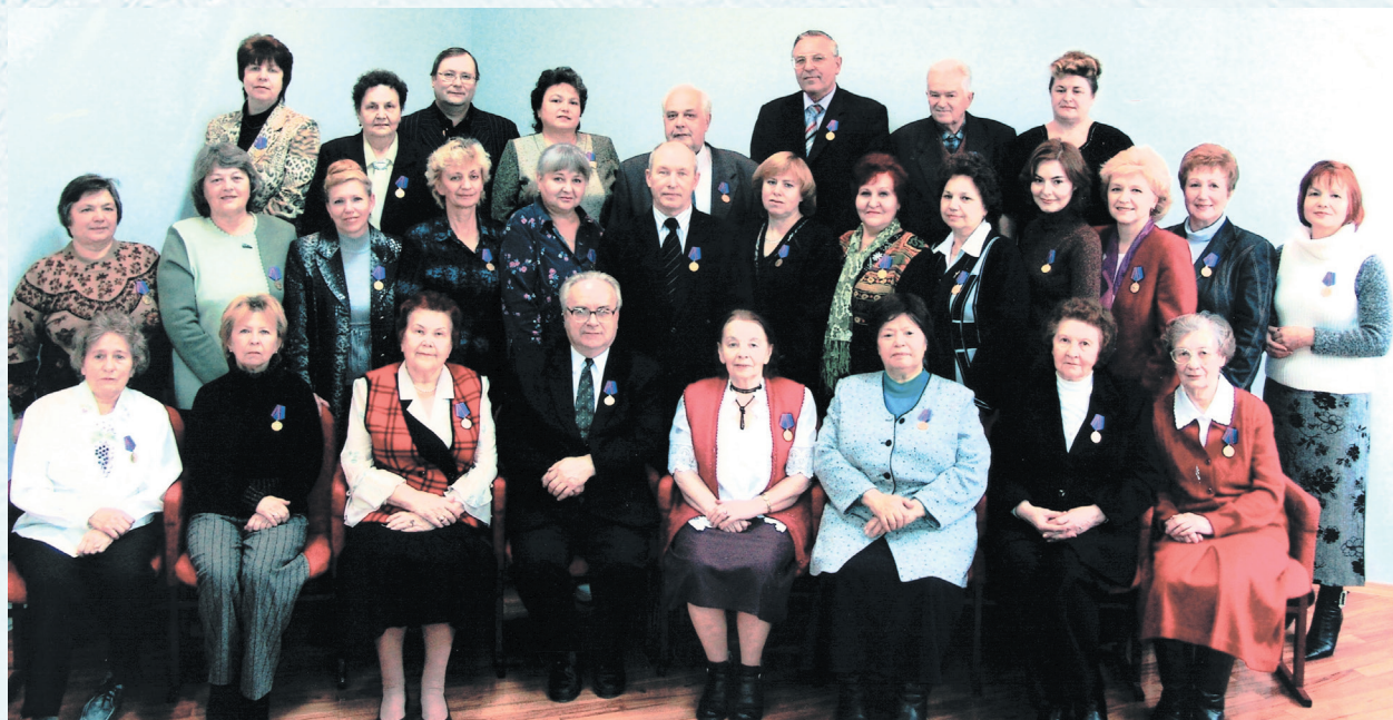
100 лет профсоюзам России. 2005 год.

Основные направления деятельности отраслевого профсоюза, его областной организации в эти годы определялись социально-экономической ситуацией, сложившейся в системе образования, проблемами, которые в наибольшей степени волновали каждого члена профсоюза. Самой главной и весьма болезненной из них оставалась проблема финансирования. К 1995 году падение производства охватило практически все отрасли экономики