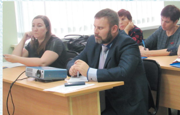
Семинар для бухгалтеров. 2018 год.

с молодёжью; оздоровление и отдых членов профсоюза. Пострадавшим вследствие пожаров и наводнений оказывается материальная помощь. Областная организация профсоюза оказывает методическую помощь; проводит индивидуальные консультации по вопросам перехода на централизованный бухгалтерский учёт.