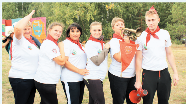
Турслёт. 2019 год.