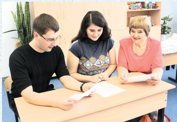
Заседание лаборатории молодых педагогов. 2016 год.

За это время можно насчитать несколько десятков удовлетворённых исков о получении пенсии по выслуге лет и многое другое. А бесплатные туристические и санаторно-курортные путёвки во все уголки нашей необъятной Родины, турслёты с песнями под гитару у костра, смотры художественной самодеятельности всегда привлекали внимание и активное участие членов профсоюза.