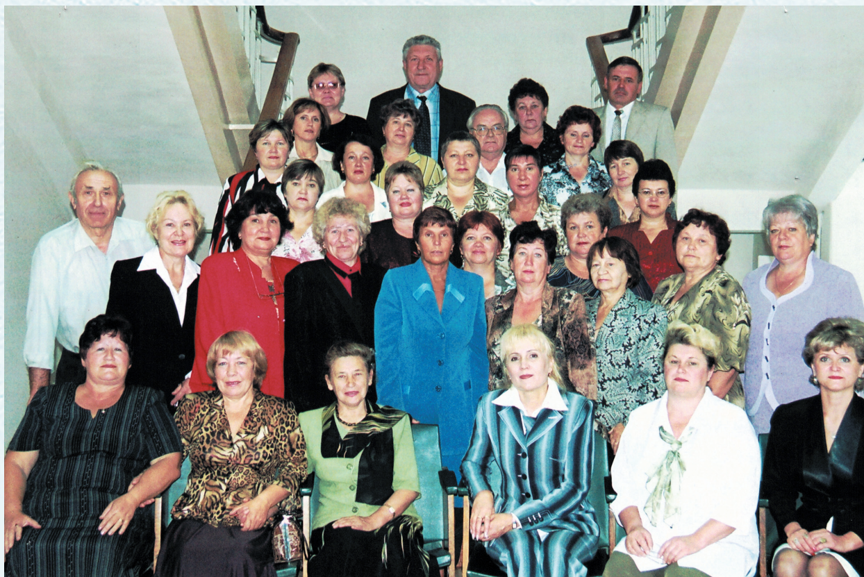
Августовская конференция. 2003 год.

Начало нового 1991–1992 учебного года в системе народного образования России было отмечено небывалым прежде ростом общественно-политической активности работников отрасли. В эти годы политическая и экономическая ситуация