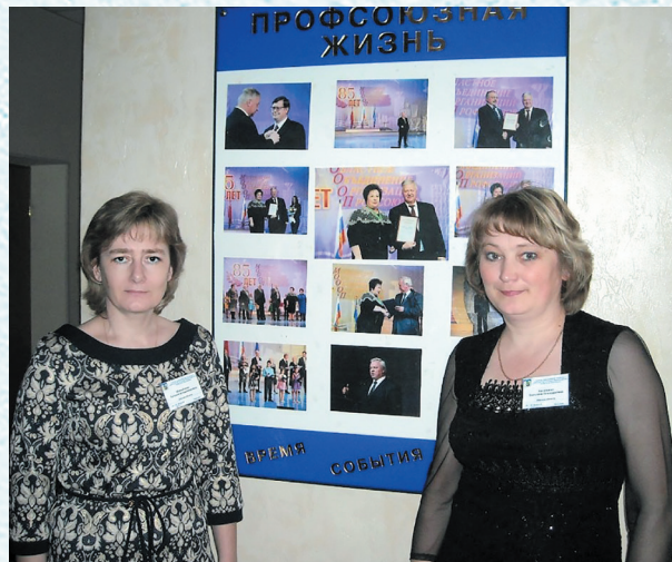
На семинаре председателей местных организаций профсоюза в Москве. 2015 год.

Сила профсоюза в массовости, единстве и солидарности, в совместных коллективных действиях. А сильный профсоюз – это равнодушные люди!