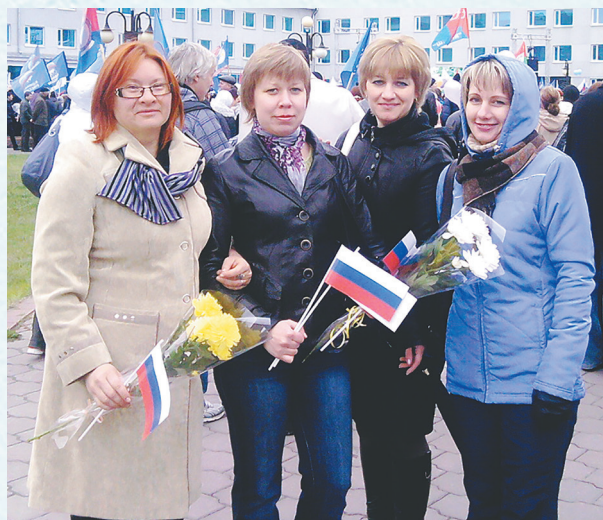
На Первомайской демонстрации. 2012 год.

В 2017 году студенческий профсоюз прекратил свое существование.