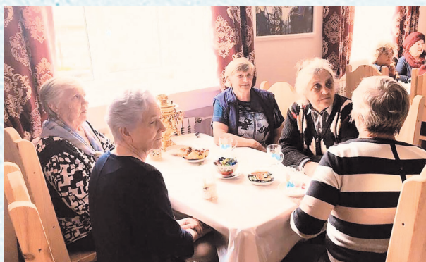
Ветераны образования за чашкой чая. 2018 год.