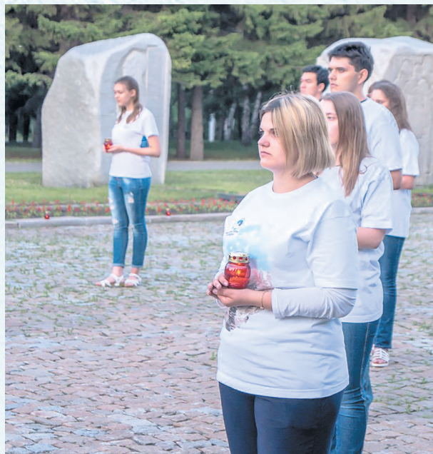
Волонтёры Победы. Свеча Памяти. 2019 год.

За время существования ППОС ОмГТУ неоднократно менялась структура организации и методы взаимодействия со студентами. Сегодня ППОС ОмГТУ – это шесть направлений деятельности: защита прав и интересов студентов, медиаосвещение, студенческие отряды, добровольчество, поддержка молодёжных проектов и инициатив, образовательные проекты; и четыре структурных подразделения: штаб студенческих отрядов ОмГТУ, ОРО ВОД «Волонтёры Победы», Медиагруппа #ВФокусе, организационно-массовая комиссия.