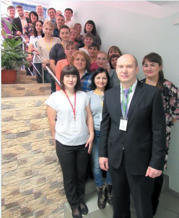
Второй Профсоюзный форум молодых специалистов системы образования Омской области «Время молодых». 2016 год.

В рамках соглашения между управлением образования города Омска и Омской областной организацией Профсоюза работников народного образования и науки РФ на 2003–2005 годы комитет профсоюза и райкомы профсоюза всех округов города в течение 2003–2004 учебного года провели совместно с управлением образования администрации города Омска конкурсы педагогического мастерства среди учителей-предметников, учителей начальных классов, молодых специалистов. Высокую оценку получили: городской профессиональный конкурс молодых учителей «Открытие», Всероссийский конкурс «Учитель года», смотр-конкурс работы с молодыми специалистами администраций учреждений образования «О