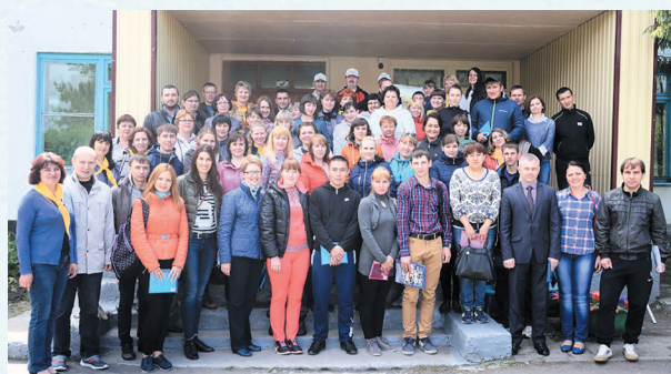
Слёт молодых педагогов. 2016 год.

Районной организацией совместно с коллективами первичных профсоюзных организаций образовательных учреждений сделано немало, но ещё больше предстоит сделать. И прежде всего в вопросах: достойной оплаты труда, выделения образовательным организациям достаточных средств на охрану труда и технику безопасности, повышения профсоюзного членства.