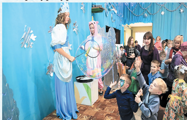
На новогоднем представлении в Омском государственном Северном драматическом театре имени М. А. Ульянова. 2019 год.

Сегодня перед Тевризской районной организацией Профсоюза стоят следующие задачи: увеличение численности членов профсоюза; повышение эффективности информационной работы через создание страничек профорганизаций на сайтах образовательных учреждений, предоставление материалов для публикации в районной газете «Правда Севера»; проведение выездных семинаров с целью обмена опытом работы; участие в конкурсах, творческих мероприятиях внутри коллектива; организация постоянно действующего правового семинара для профактива с привлечением отдела по труду, работников прокуратуры и социальной защиты.