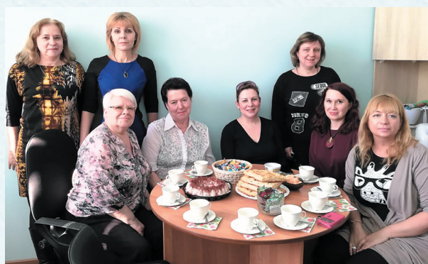
В день рождения Профсоюза Омской области. 2019 год.

ППОР СибАДИ принимает участие в конкурсах, организованных обкомом профсоюза, в различных акциях, проводимых облпрофорганизацией и Федерацией омских профсоюзов, ведёт постоянную работу с сотрудниками по вопросам целесообразности профчленства.