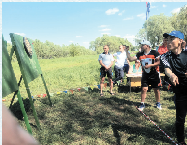
Летняя спартакиада. Дартс. 2018 год.