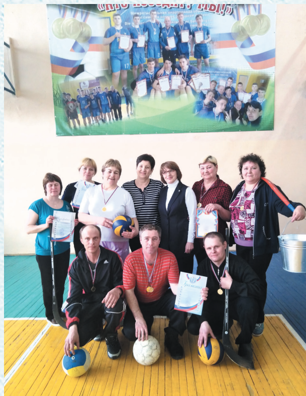
Первичная профсоюзная организация Таскатлинской основной школы. 2019 год.