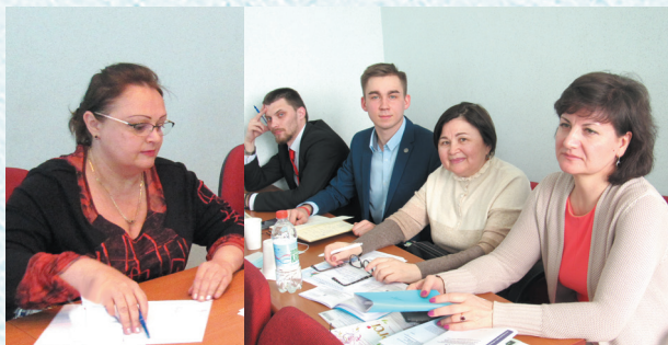
Работа профильных комиссий высшего профессионального образования. 2020 год.