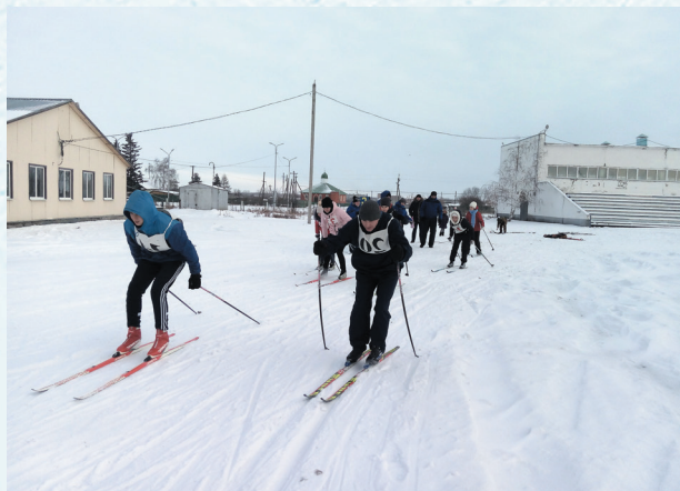
Зимняя спартакиада. Лыжные гонки. 2018 год.

Профактив Москаленской районной организации Профсоюза работников народного образования и науки РФ намерен продолжать активные действия по изменению системы оплаты труда в целом по РФ и Омской области в частности. Освоить и широко использовать в практике систему АИС в первичных организациях. Работать над включением в систему «Профкардс» торговых точек в сельской местности.