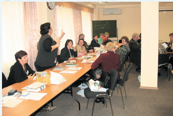
Семинар-совещание председателей местных организаций профсоюза в Москве. 2016 год.

Сегодня профсоюз сопровождает все сферы деятельности человека педагогического труда, поддерживает молодёжь и окружает заботой ветеранов, позволяет грамотно ориентироваться в ходе развития событий в стране, регионе, округе, благодаря чему имеет заслуженный авторитет и получает от педагогических работников признательность и благодарность.