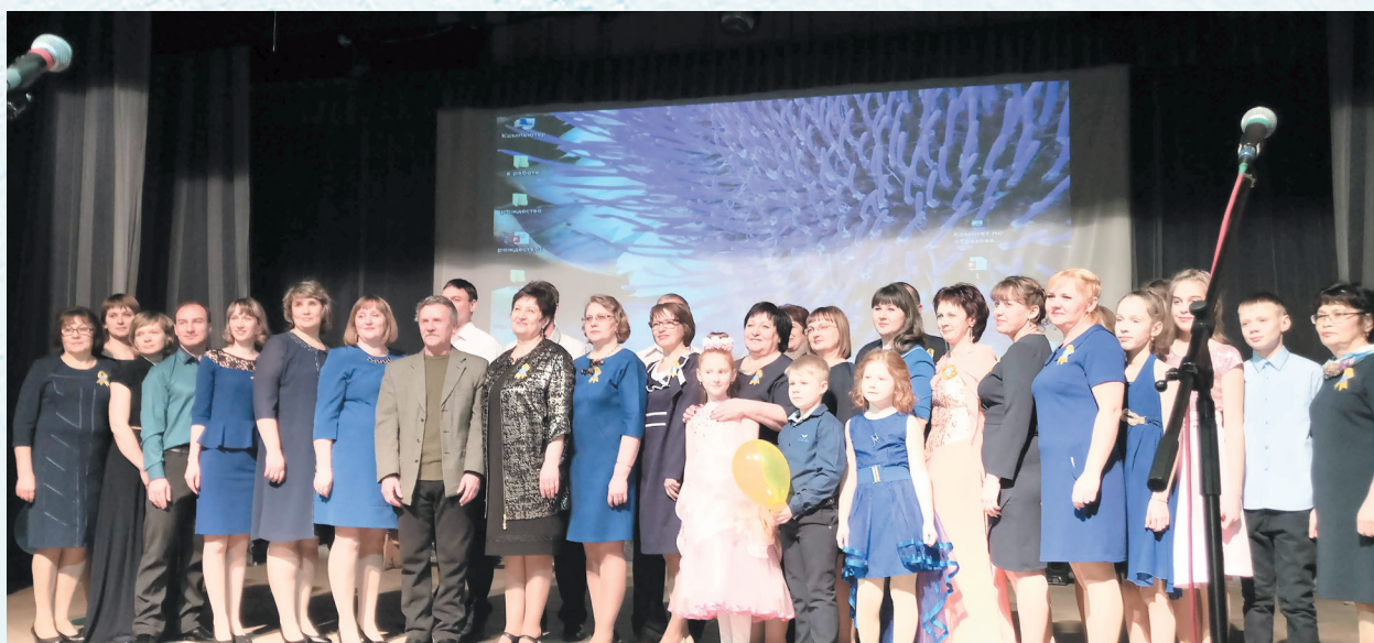
Конкурс творческих коллективов. 2019 год.