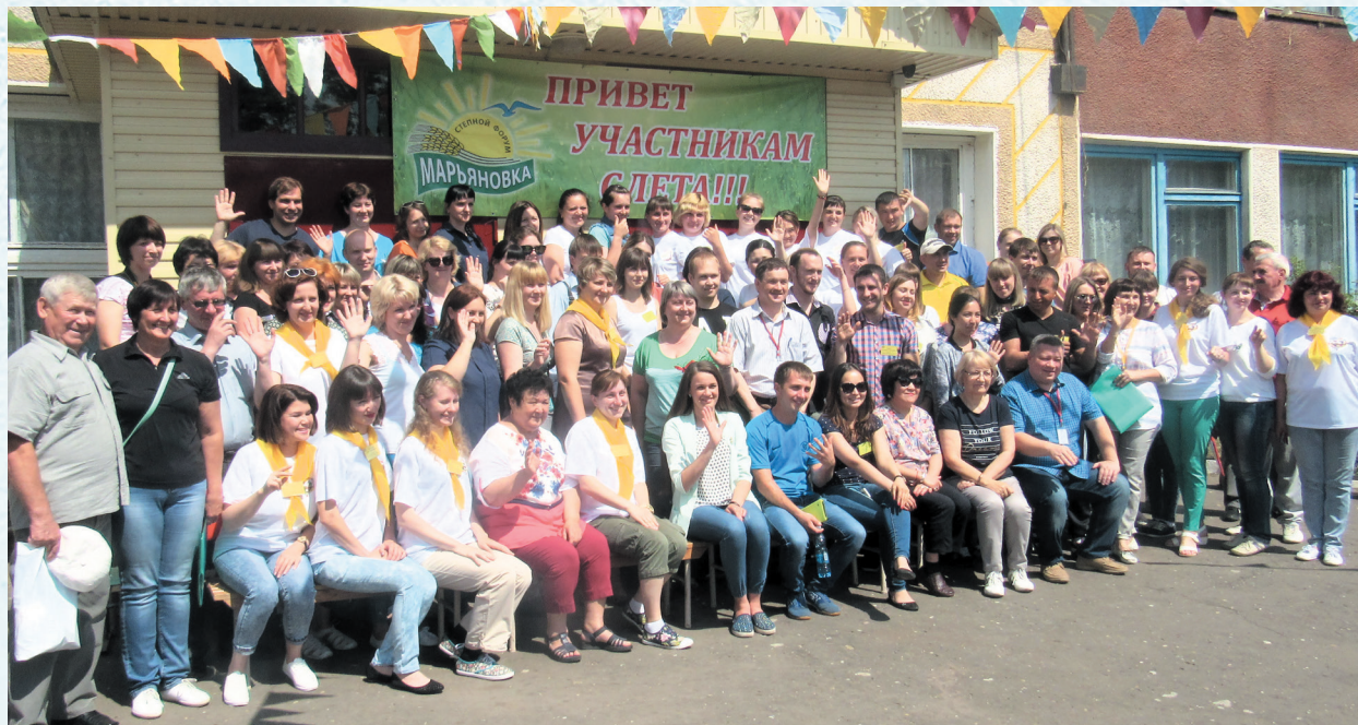
Участники семинара-совещания Сибирского Федерального округа на слёте молодых педагогов в Марьяновке. 2017 год.

В рамках общероссийской акции профсоюзов «За достойную заработную