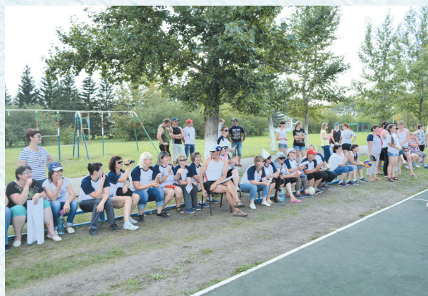
Спартакиада работников образования. 2016 год.