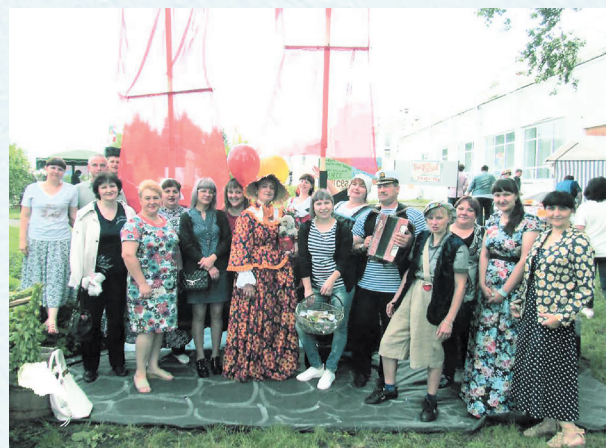
На празднике села. 2016 год.