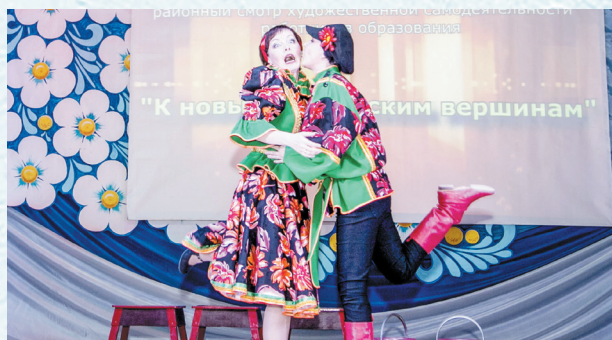
Конкурс «К новым творческим вершинам». 2019 год.