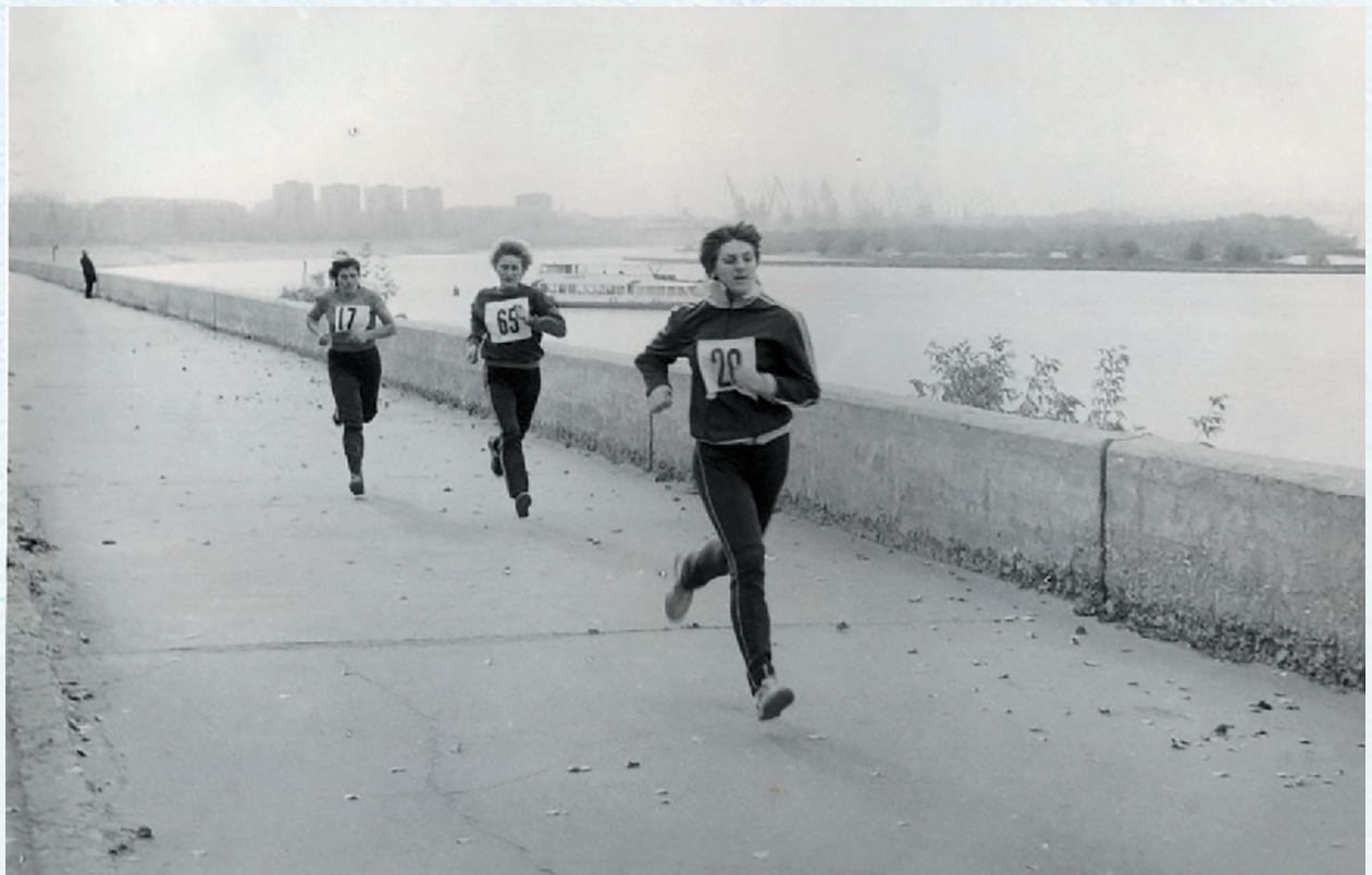
Областная спартакиада . 1984 год.