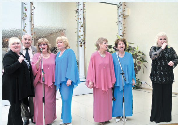
Концерт для ветеранов войны и труда. 2012 год.