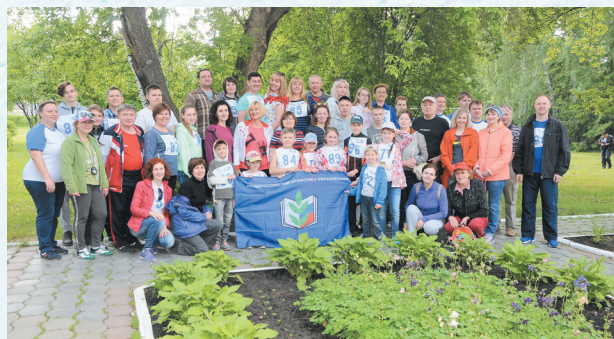
День здоровья в «Аэлите». 2018 год.

Сегодня команда ОмГУ по волейболу сформирована из студентов и сотрудников. Кафедра теоретической физики к тренировочным играм привлекает студентов и магистрантов. Становясь работниками университета, бывшие студенты вступают в профсоюз ещё и для того, что-