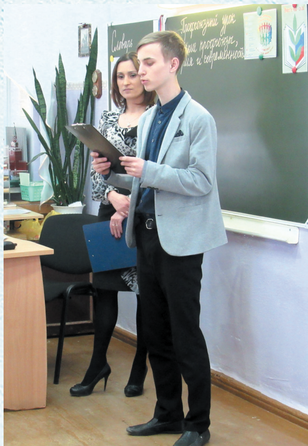
Профсоюзные уроки. 2018 год.

Каждодневная и внешне незаметная работа с органами власти и управления при широкой поддержке членов профсоюза позволили сдерживать многие, хотя и не все негативные тенденции при