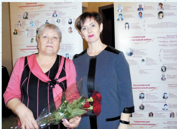
На слёте педагогических династий. 2019 год.