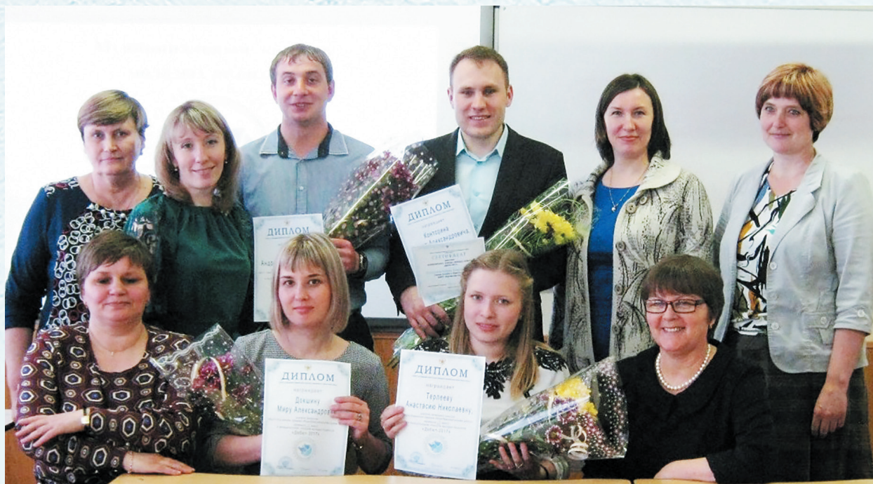
Победители муниципального этапа конкурса профессионального мастерства «Дебют». 2017 год.

Профсоюз – это общественная организация, которая объединяет работников, связанных родом деятельности и профессиональными интересами. От того, насколько успешно профсоюз будет работать в интересах каждого конкретного человека, зависит дальнейшая его судьба и авторитет.