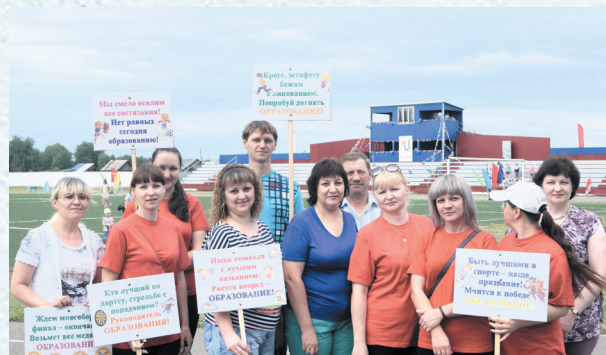
Спортивные соревнования «Королева спорта». 2016 год.