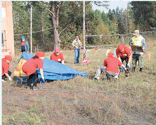
На туристическом слёте. 2017 год.