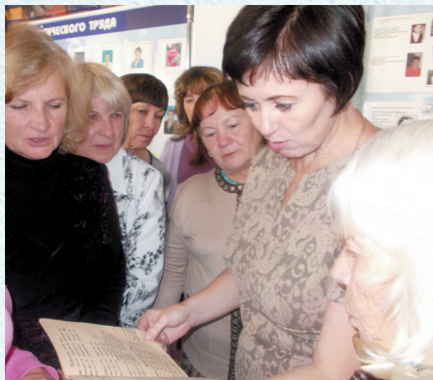
Встреча работников техникумов Омской области в музее истории развития системы образования Калачинского муниципального района. 2018 год.

Сегодня районная профсоюзная организация стоит на страже защиты социально-экономических интересов каждого члена профсоюза. Проводится большая работа по выполнению комплекса мер по реализации основных положений Программы социально-экономического развития района. В этом направлении работа ведётся в тесном сотрудничестве с Комитетом по образованию Калачинского муниципального района.