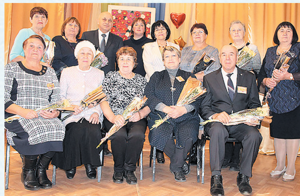
Встреча ветеранов педагогического труда. 2020 год.