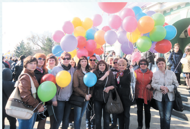
На первомайской демонстрации. 2016 год.

Советский райком использует в информационной работе электронную почту, Интернет, в социальных сетях для мобильной передачи информации создана группа «Мой Профсоюз».