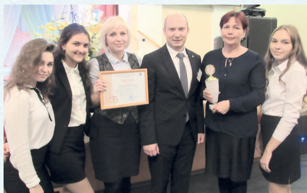
Лаборатория молодых педагогов. 2017 год.

У профсоюзного комитета много планов. В перспективе новые проекты по мотивации вступления в профсоюз, культурно-массовой и спортивно-оздоровительной работе, развитию информационной работы и социального партнёрства. Хочется, чтобы каждый работающий в образовании человек осознавал, что единому, сплочённому, постоянно развивающемуся профессиональному союзу по плечу решение важнейшей задачи – сделать профессию педагога престижной.