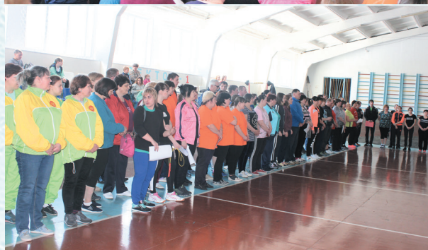
Спартакиада работников образования. 2016 год.