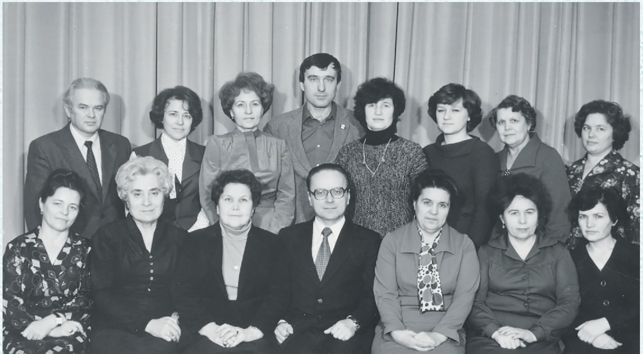
Профактив Омского обкома работников образования. 1981 год.