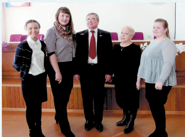
Встреча молодых педагогов с депутатом Государственной думы О. Н. Смолиным. 2018 год.

Сегодня на учёте в районной организации 68 первичных профорганизаций. Приоритетными направлениями являются: укрепление единства и повышение эффективности деятельности первичных профорганизаций, развитие инновационной деятельности, оздоровление работников образования и членов их семей, охрана труда, обучение профактива, обобщение и распространение опыта по различным направлениям профсоюзной жизни, мотивация профсоюзного членства, информационная деятельность.