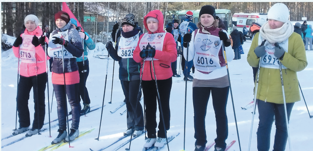
«Лыжня России». 2018 год.