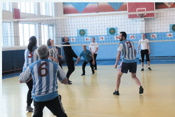
Спартакиада. Волейбол. 2019 год.

Все проводимые мероприятия направлены на вовлечение работников системы образования в профсоюзное движение, на привлечение молодых педагогов в профсоюзные ряды, на сплочение членов коллектива профсоюзной организации.