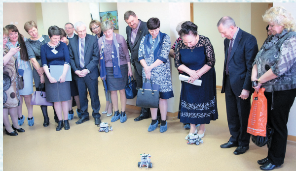
На обучающем семинаре в Казани. 2016 год.

защита прав членов профсоюза на здоровые и безопасные условия труда; оздоровление и страхование членов профсоюза; повышение профсоюзного членства; привлечение молодёжи для участия в форумах и различных смотрах-конкурсах.