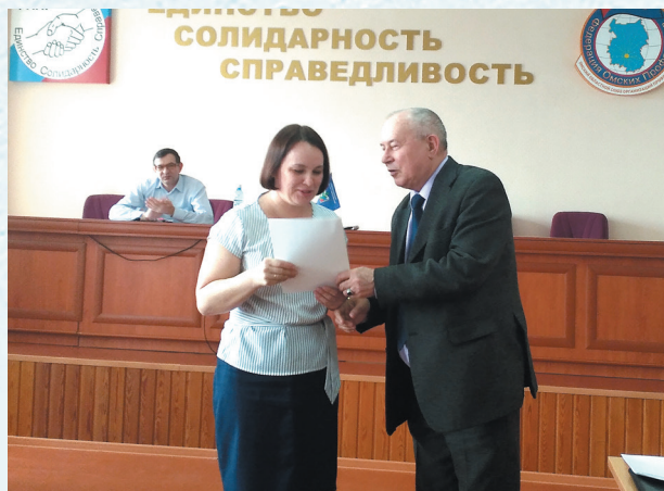
Награждение лучших уполномоченных по охране труда. 2019 год.

Работа, которая проводится областной организацией в сфере охраны труда, значительно способствует снижению производственного травматизма и профессиональных заболеваний. Это – улучшение условий труда на рабочих местах через коллективные договоры и соглашения, которые заключаются с работодателем по инициативе профсоюза; проверки соблюдения законодательства по охране труда; отстаивание интересов работников; обучение по охране труда и многое другое. Областная организация активно контролирует проведение специальной оценки условий труда на рабочих местах, быстро реагирует на индивидуальные обращения работников образовательных организаций, связанные с разъяснением вопросов по созданию системы управления охраной труда, специальной оценки условий труда, проведение расследования и оформления несчастных случаев, доплаты за вредные и опасные условия труда. Не остаются в стороне вопросы, связанные с обеспечением общественного контроля, проведением медицинских осмотров, обеспечением