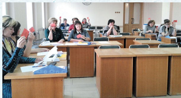
Голосуют делегаты отчётно-выборной конференции. 2019 год.

Сегодня перед профсоюзной организацией стоят следующие задачи: информирование членов профсоюза об изменениях в законодательстве РФ, об основных направлениях деятельности профсоюза;