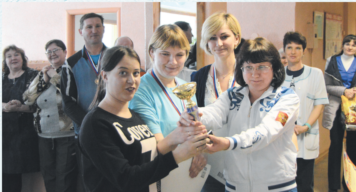
Итоги спартакиады подведены. Лучшие получают награды. 2016 год.