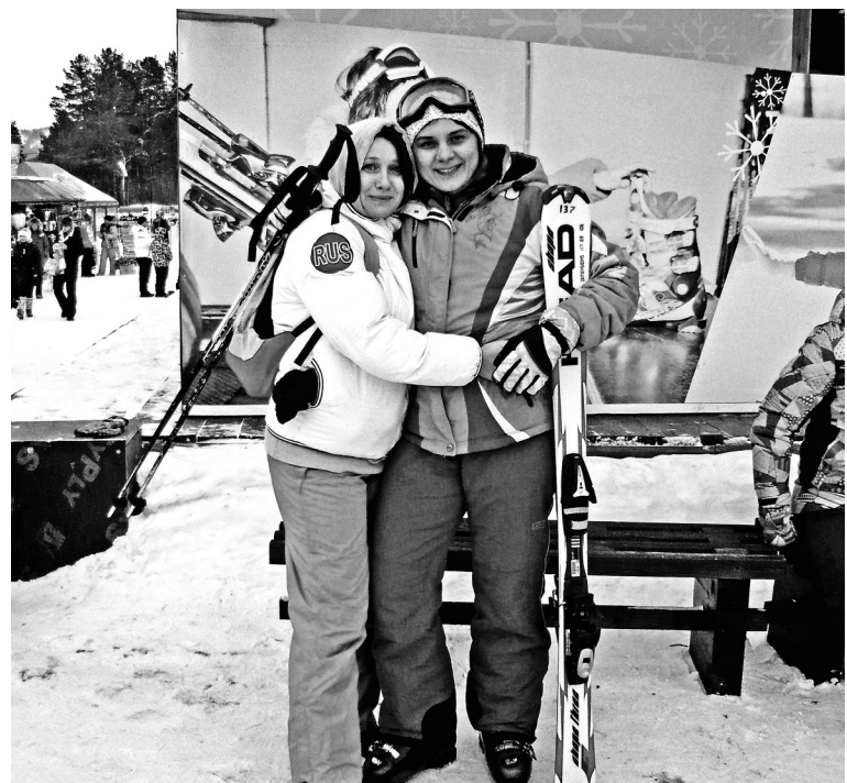
На горнолыжном подъемнике в Белокурихе