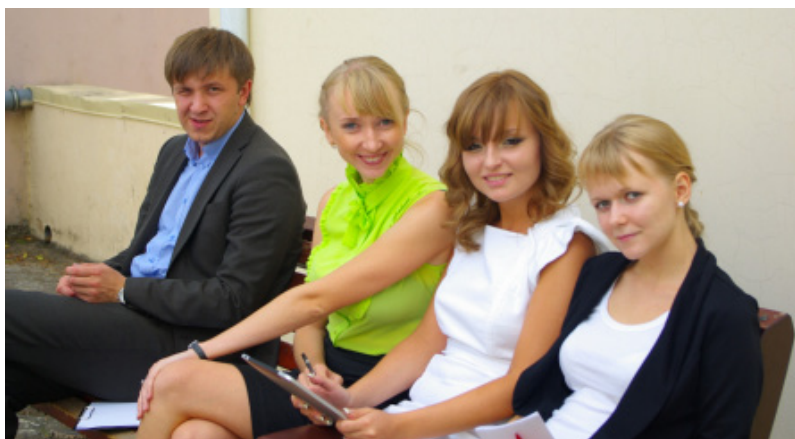
Конкурсанты в ожидании своего выхода