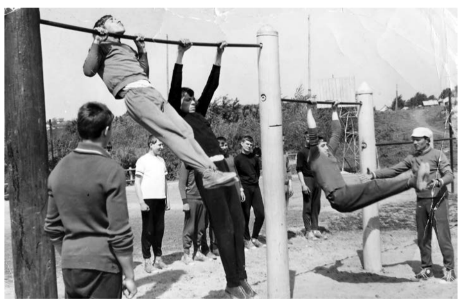
Урок физкультуры в Гремяченской школе