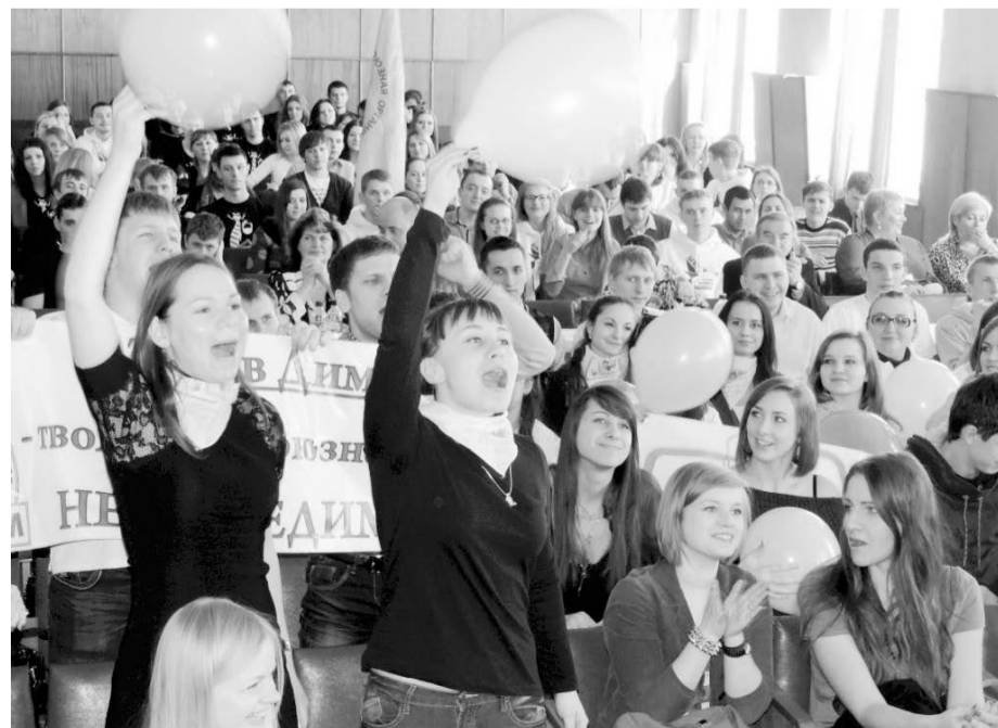
Болельщики в зале