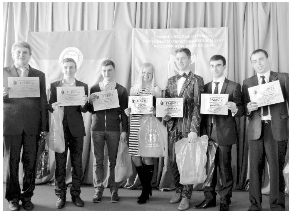
Без грамот и подарков никто не остался

Среди нынешних соперников оказалось немало давних знакомых, поэтому внешне казалось, что и никакой конкуренции между ребятами нет. Зрители дружно по-