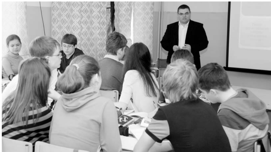
Сергей ВИШТАЛЮК: «Что вы думаете о крепостном праве?»