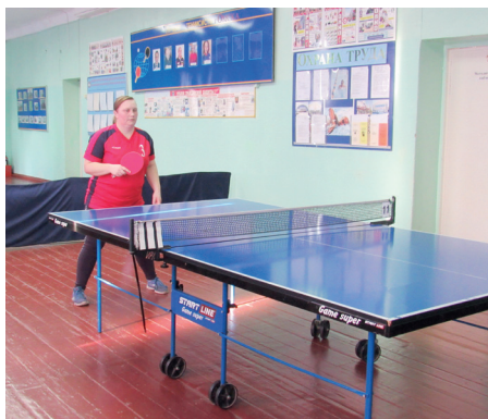
(Окончание. Начало на с. 7)

приняли участие девять команд из Омска и Омской области.