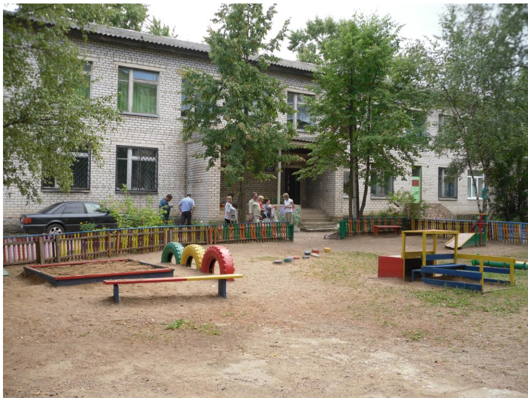
Чествование ЮБИЛЯРОВ дошкольных учреждений