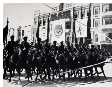
Казаки на параде. 1936 год