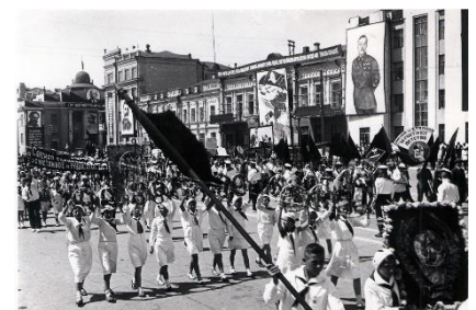
Колонна пионеров. 1937 год

Празднование 1 мая в 1926 году носило строго политический характер, демонстрировало международную пролетарскую солидарность и отражало особенности переживаемой полосы общего подъема СССР и роста социалистического строительства. Праздновали 1 мая три дня: 1, 2 и 3 мая. Профорганизации устраивали поездки за р. Волгу, катание на реке, прогулки, экскурсии и т. д. для рабочих, служащих и их семей. День 3 мая объявлялся детским праздником и днем физкультуры.