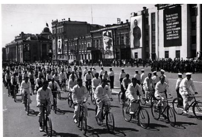
Участники демонстрации. 1936 год