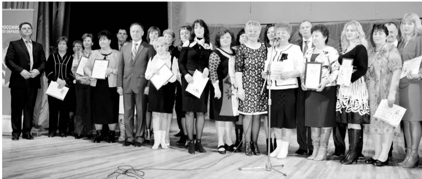
Награждение победителей конкурсов

- Особенно приятно получить заслуженную награду при большом количестве коллег, партнеров, средств массовой информации. Торжественная атмосфера Дворца детского творчества, присутствие представителей краевой Думы, Министерства образования и гостей из соседних республик подтверждает важную роль профсоюзного движения в жизни общества. Приглашение работодателей на столь значимый форум профсоюзных лидеров еще раз доказывает, что только совместными усилиями мы можем решить многочисленные проблемы педагогического сообщества. Работодатель так же, как и профсоюз, заинтересован в профессиональном росте своих педагогов, повышении их заработной платы, признании социального статуса. Социальное партнерство на всех уровнях - вот путь решения вопросов в современном обществе. Все участники форума, будь то руководитель детского сада, председатель первички, ректор вуза или студент, получили заряд положительных эмоций,