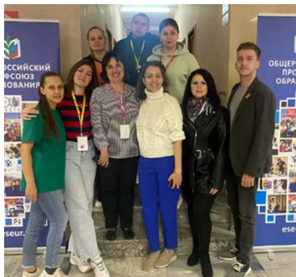
Пресс-центр в полном составе

«Это сплошь лидеры, очень яркие, профессиональные, они объединены любимым делом, которое называется ВПШ Профсоюза. Отзывчивые, всегда приходят на помощь. Мы спокойны за тот функционал,