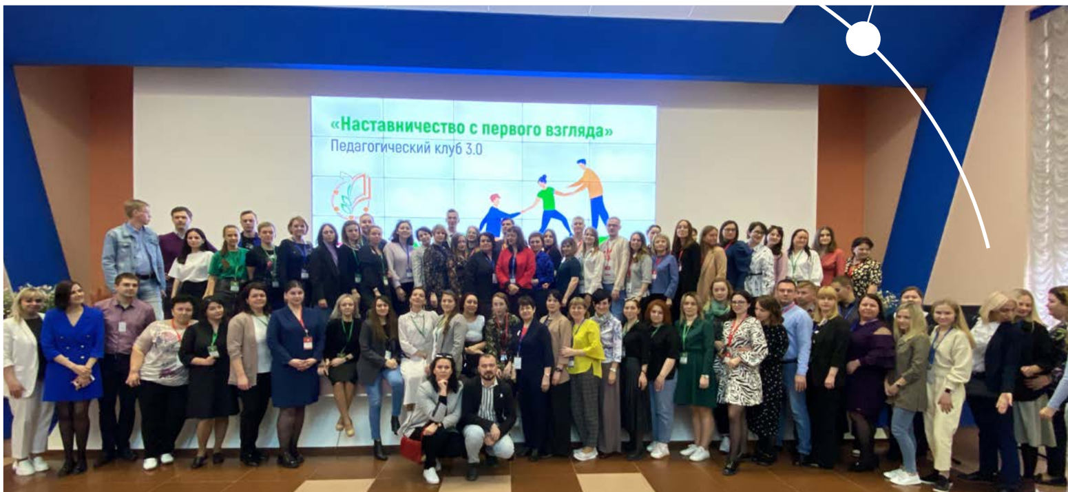
Общее фото на память

Второй день ВПШ Профсоюза начался с того, что наши команды посадили в автобусы и отправили по разным адресам. Для одних участников школы утро началось с посещения Центра толерантности, для других – с визита в учебно-исследовательский центр Московской федерации профсоюзов. О том, как мы были гостями московских профсоюзов, точнее Московской городской организации (МГО) Общероссийского Профсоюза образования, мы и расскажем.