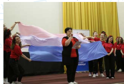
Выступает команда в красных футболках