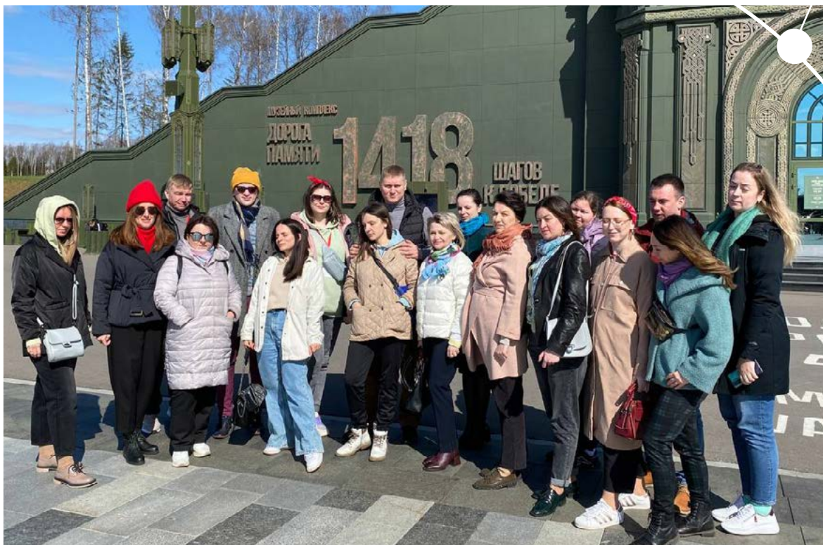
В парке «Патриот»

В финальный день ВПШ Профсоюза молодые педагоги, преподаватели и наставники посетили военно-патриотический парк культуры и отдыха вооруженных сил Российской Федерации. В комплекс входит потрясающая экспозиция «Дорога памяти». Каждому, кто приходит сюда, предлагают пройти 1418 шагов – именно столько дней длилась Великая Отечественная война. Экспозиция включает 35 залов, 27 из которых – иммерсивные, с эффектом погружения. Слезы сами наворачиваются на глаза... Невозможно не восхищаться работой мастеров, создававших этот музейный комплекс. Огромная благодарность им и низкий поклон!