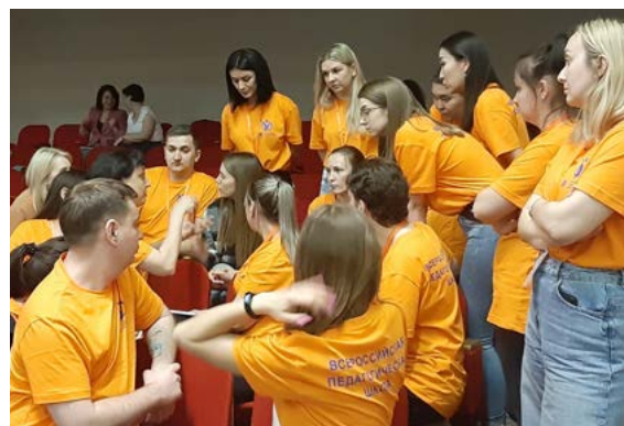
Команда желтых обсуждает, как победить буллинг