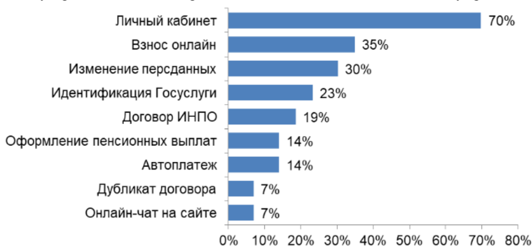
Рисунок 3. Представленность онлайн-сервисов у фондов (доля от числа всех НПФ) (по данным сайтов НПФ)

Непопулярным является и сервис онлайн-чат - он также есть только у трех НПФ.