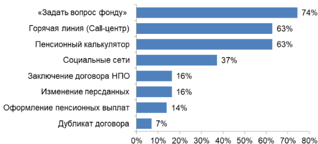
Рисунок 1. Представленность дистанционных сервисов у фондов (доля от числа всех НПФ) (по данным сайтов НПФ)

По почте может быть отправлен и дубликат договора с НПФ (такая услуга имеется у 7% фондов).