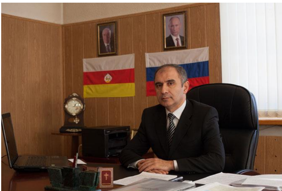
Тедеев Вадим Ботазович - Ректор Юго-Осетинского государственного университета.

Стороны принимают совместные усилия для эффективной защиты интересов и прав работников, профсоюзных прав и свобод, демократических принципов гражданского правового общества, достойного места и роли профсоюзов в обществе и государстве.