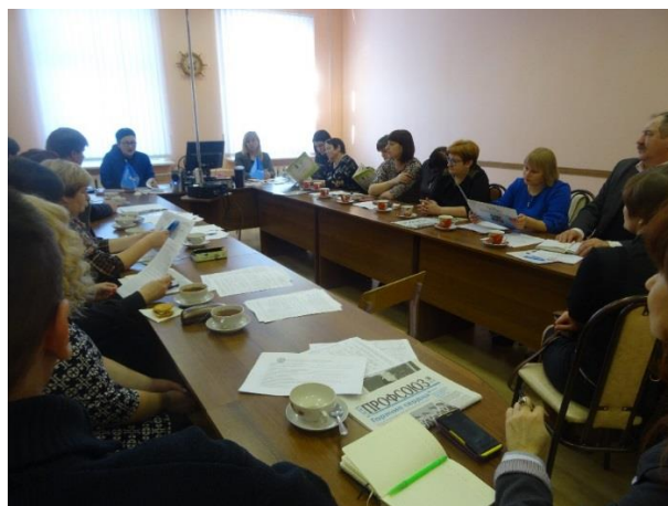
На фото: День Профсоюза в Новосокольническом районе, март, 2018 г.