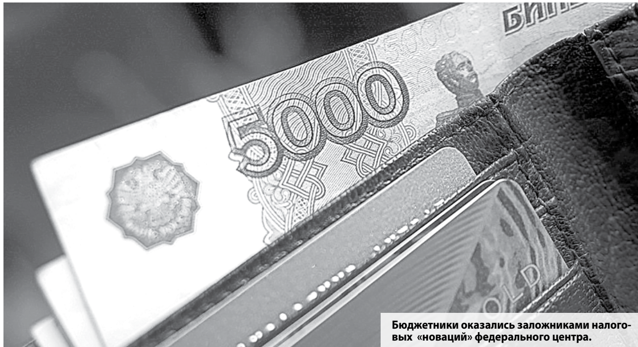
Бюджетники оказались заложниками налоговых «новаций» федерального центра.