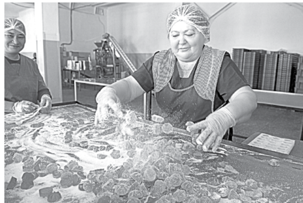
Низкокалорийный мармелад могут есть даже те, кто на диете.

Седьмого декабря глава региона осмотрел предприятие пищевой промышленности - кондитерскую фабрику «КАРОН».