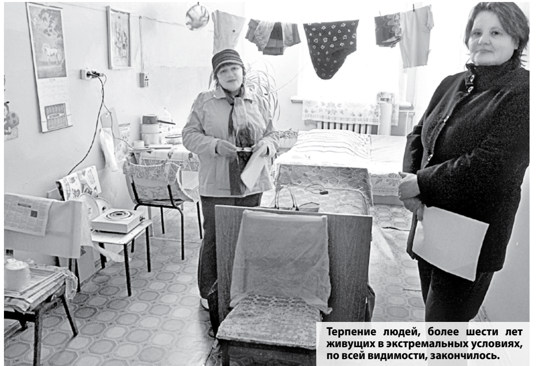
Терпение людей, более шести лет живущих в экстремальных условиях, по всей видимости, закончилось.