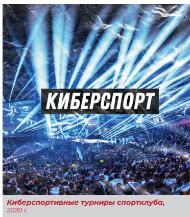
Киберспортивные турниры спортклуба, 2020 г.

Не прекратил свою работу и спортивный клуб. Во время самоизоляции студенческий спортивный клуб активно проводил дистанционные киберспортивные онлайн-турниры по таким дисциплинам, как PUBG Mobile, DOTA 2, CS:GO и другие.