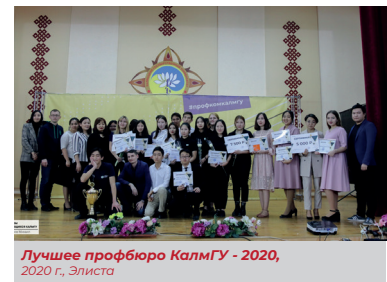
Лучшее профбюро КалмГУ - 2020, 2020 г., Элиста

новое - «Квиз», которое представляло собой целую череду испытаний, моделирующую различные направления работы профбюро. В ходе очного этапа участники должны были представить свое профбюро и продемонстрировать умение ориентироваться в экстремальной обстановке. Не обошлось и без творческих конкурсных заданий: съемка тематических видеороликов позволило раскрыть творческий потенциал профбюро в сфере медиа.