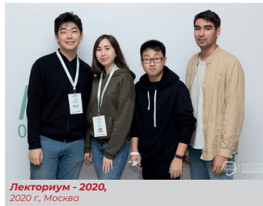
Лекториум - 2020, 2020 г., Москва

вились пополнять свой багаж знаний на Всероссийскую образовательную площадку «Лекториум – 2020» в г. Москва, в рамках которой прошли обучающие мастер-классы и лекции по 4 актуальным направлениям работы в студенческой среде: SMM в студенческой организации, медиа-служба, проектная работа и школа тренеров.