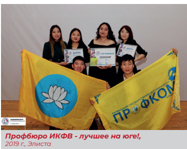
Профбюро ИКФВ - лучшее на юге!, 2019 г., Элиста

В 2019 году ребята вновь стали первыми. Впервые в нашей Республике состоялся конкурс «Лучшее профсоюзное бюро Южного федерального округа - 2019» , по итогам которого профбюро института калмыцкой филологии и востоковедения стало лучшим.