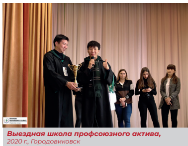
Выездная школа профсоюзного актива, 2020 г., Городовиковск

приобрести различную атрибутику за особый номинал Школы – «профкоины», которые они получили от организаторов за проявление инициативы и активное участие в программных мероприятиях.