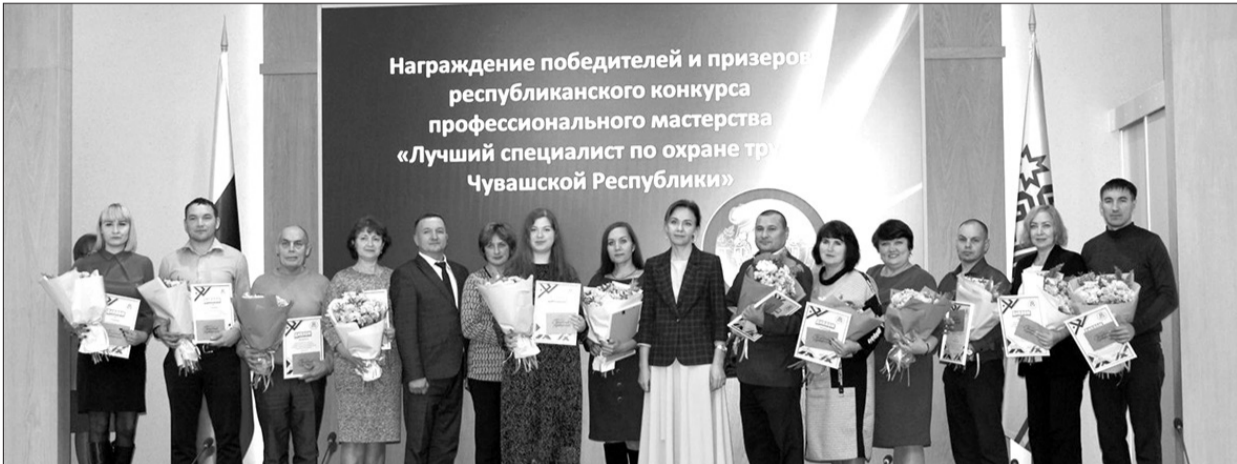
Награждение победителей и призеров республиканского конкурса профессионального мастерства «Лучший специалист по охране труда Чувашской Республики»

По инициативе Минтруда Чувашии для роста престижа профессии специалиста по охране труда 9 ноября 2023 года состоялся конкурс профессионального мастерства «Лучший специалист по охране труда Чувашской Республики». Ежегодно в республике в нем принимают участие более 70 специалистов. В этом году по результатам отборочных туров в финал конкурса прошли 13 участников, показавшие наилучшие результаты на муниципальном уровне.